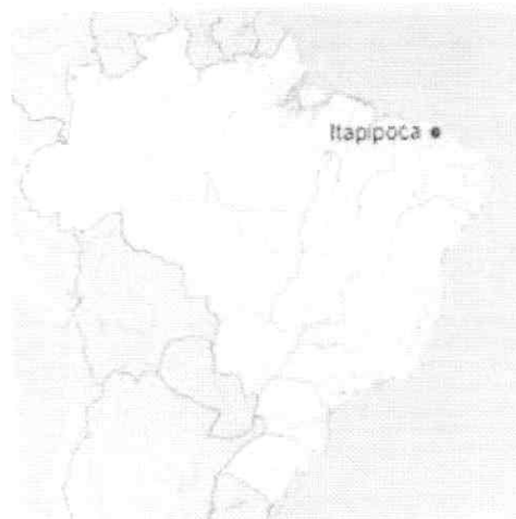
Localização de Itapipoca no Brasil