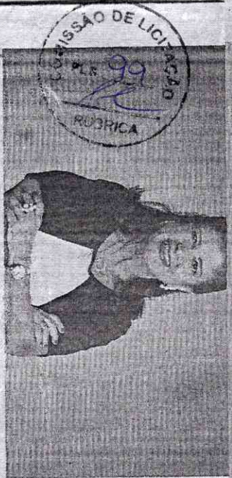
LUIZA Helena Trajano, presidente do Conselho de Administração da Magalu