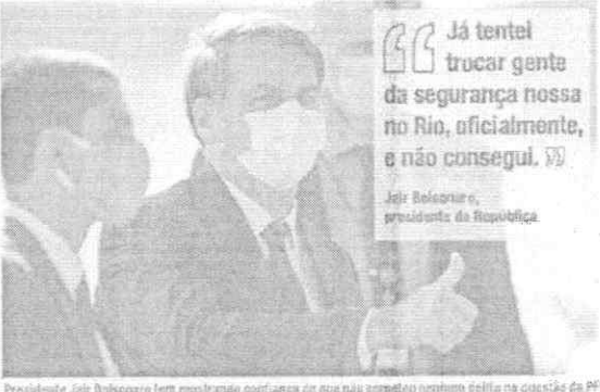
Presidente Jair Bolsonaro tem em seu gabinete o que não cometeu nenhum delito na questão da PF

A equipe de procuradores-gerais da República, Augusto Aras, vê indícios de que o presidente Jair Bolsonaro (sem partido) cometeu alguns dos seguintes delitos do, aproximadamente, indicados: advocacia administrativa, advocacia administrativa, ou afronta a um dispositivo da lei de abuso de autoridade. A avaliação, preliminar, é feita com base nos últimos elementos de prova que vieram à tona no inquérito que abriu-se a instância do mandatório da corporação, denunciada pelo ex-ministro da Justiça Sérgio Moro, (tinha como objetivo blindar parentes e aliados políticos em investigações).