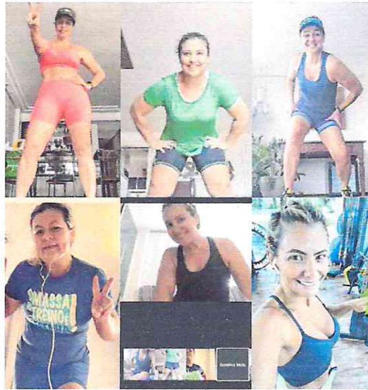
Grupos se reúne cianriar ente para a prática orientada de exercícios. Aulas são por vídeo