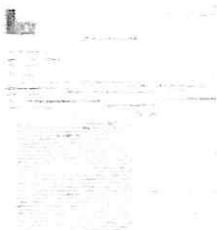
Readequada Massape 02.tiff 8981K