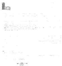
Readequada Massape 01.jpeg 528K