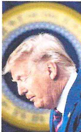
Presidente Donald Trump vai buscar a reeleição em 2020

Pela manhã, Trump tuitou que não fez "nada de errado", no dia seguinte ao envio de uma carta à líder da Câmara, Nancy Pelosi, afirmando que "a história a julgará duramente" pelo processo. Mais tarde, continuou escrevendo na rede social que este processo é "um ataque contra os Estados Unidos e contra o Partido Republicano". Já Pelosi disse que