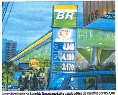
Posto localizado na Avenida Rogadano Leite vende o litro da gasolina por R$ 4,04. Em alguns estabelecimentos, o valor chega a R$ 4,29.

No Rio de Janeiro, o combustível saiu de R$ 4,651 para R$ 4,661, em média, alta de 0,22%.