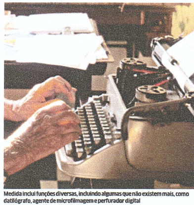
Medida inclui funções diversas, incluindo algumas que não existem mais, como datilografar, agente de microfilmagem e perfurador digital

Outra mudança, que entra em vigor automaticamente, é a proibição de novos concursos públicos ou a ampliação do número