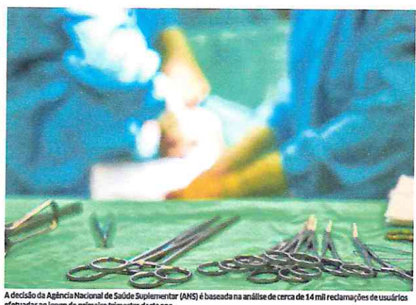
A decisão da Agência Nacional de Saúde Suplementar (ANS) é baseada na análise de cerca de 14 mil reclamações de usuários efetuadas ao longo do primeiro trimestre deste ano.