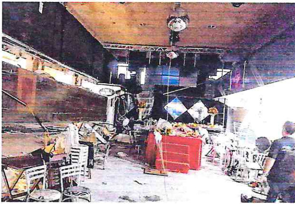
O estabelecimento não tinha auto de Vistoria do Corpo de Bombeiros, uma exigência para garantir as condições de segurança contra incêndio e pânico. Foram socorridas 11 vítimas, que tiveram escoriações e ferimentos leves.

Os Bombeiros informam que, entre as 11 vítimas socorridas pelos militares, estão pessoas com escoriações e ferimentos leves. Elas foram encaminhadas ao Centro Hospitalar de Santo André, o Pronto Socorro Central e o Hospital Municipal de São Bernardo do Campo. A Defesa Civil de Santo André visitou o