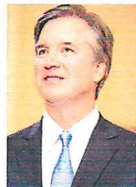
Brett Kavanaugh ainda conta com o apoio do presidente dos EUA para assumir cargo vitalício.

A Comissão de Justiça e seu presidente, o republicano Chuck Grassley, desejam ouvir seu testemunho, bem como o de Kavanaugh, acusado pela professora universitária de 51 anos de assediá-la durante uma noite de bebedeira na década de 1980 em um subúrbio de Washington. O magistrado nega a acusação e