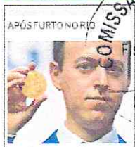
Iraniano recebe nova medalha Fields

Para a Associação Brasileira de Empresas de Pesquisa, entrevistas com eleitores que não sejam face a face não são recomendadas, pois "nem sempre retratam com fidelidade a percepção real da maioria dos eleitores".