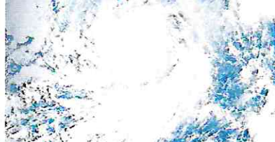
Imagem de satélite mostra o deslocamento do furacão Rosa no mar aberto, em direção à costa do México.

Até menos oito pessoas morreram, e outras seis estão desaparecidas depois que uma forte chuva atingiu um povoado de Michoacán, provocando o transbordamento de um rio e uma represa. Na semana passada, fortes chuvas afetaram também Sinaloa e até ao menos três mortos e três desaparecidos. Devido às chuvas, o solo está saturado. Há riscos de deslizamentos, transbordamento de rios e córregos ou danos em trechos de estrada.